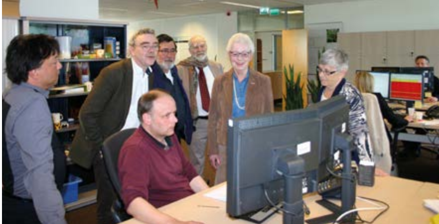
De Cliëntenraad brengt een bezoek aan de afdeling V&O.

De Raad werkt nauw samen met het ministerie van VWS, het management van de afdeling Verzetsdeelnemers en Oorlogsgetroffenen, de Raad van Bestuur van de SVB en de Cliëntenraad.