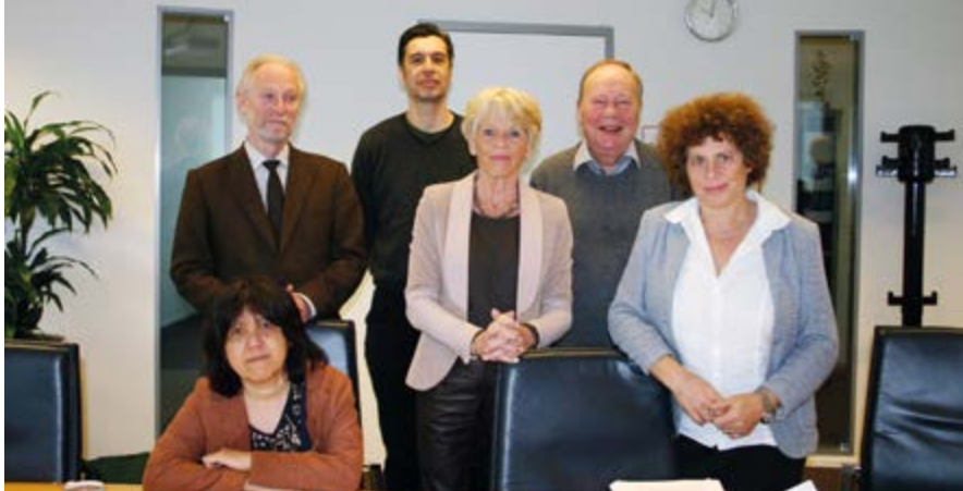
Pensioen- en Uitkeringsraad.

Naast de plenaire vergaderingen, waarin beleidswijzigingen of vaststellingen aan de orde kwamen, vergaderde de sectie bestuur over bestuurlijke zaken. Beslissingen en adviezen over individuele aanvragen werden in aparte casuïstieksessies vastgesteld. De Raad in 2017 in wisselende samenstelling zesendertig keer bijeen.