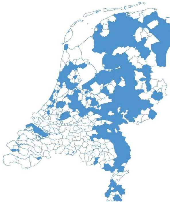
Figuur 4.1 Spreiding van de deelnemers cohorten 2015 en 2016 (tot juli 2016) over de gemeenten (n=431)

In totaal zijn 166 gemeenten vertegenwoordigd in deze cohorten. Dat is 43 procent van de gemeenten in Nederland (het aantal gemeenten in 2016 is 390). Weinig deelnemers komen uit de grootste gemeenten van Nederland. Acht deelnemers zijn afkomstig uit één van de G4-gemeenten, waarvan vijf uit Utrecht. Geen van de deelnemers komt uit Eindhoven, Tilburg of Breda.