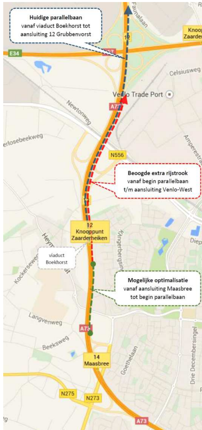
Figuur 1 Overzichtskaat