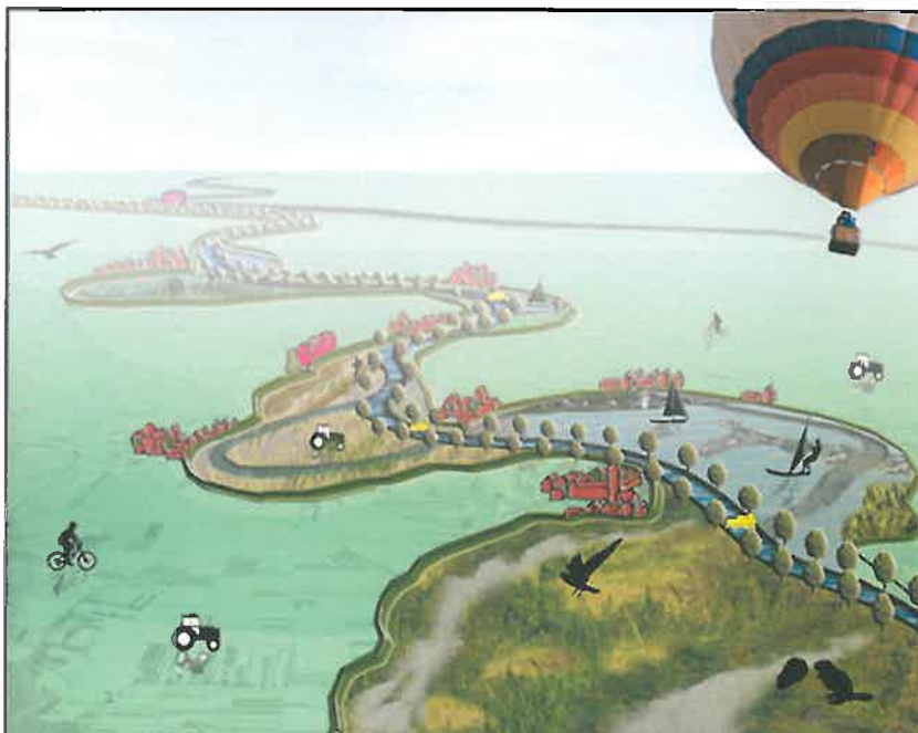
Figuur 1: het perspectief op de Meanderende Maas.

In het BO MIRT van 12 oktober 2016 is ingestemd met de start van een integrale verkenning voor Ravenstein-Lith. De start van de verkenning is onderdeel van een samenhangend pakket aan waterveiligheidsmaatregelen voor de gehele Maas. Dit pakket geeft invulling aan de urgente hoogwaterveiligheidsopgave en verbindt die met lokale ruimtelijke en economische ambities.