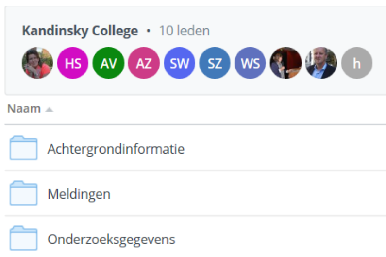
Figuur 4.1 Voorbeeld indeling digitaal dossier

Bij de scholen die een melding hebben gedaan, zijn kennismakingsbezoeken afgelegd en worden monitorplannen ontwikkeld.