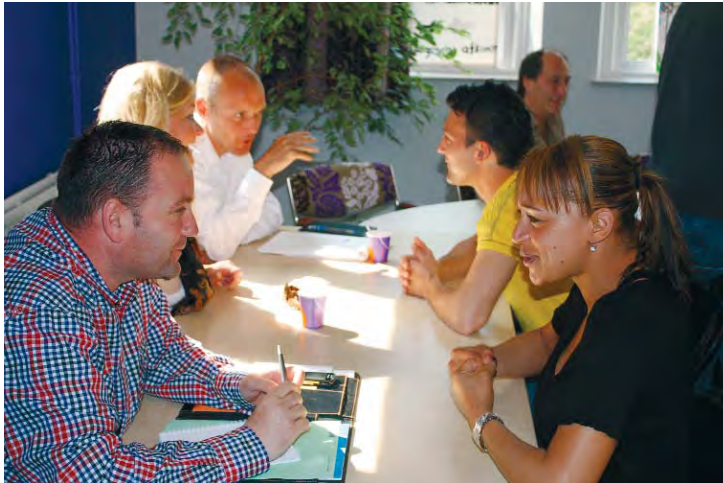
Speeddaten: jongeren- coaches en de klankbordgroep

tijdens zo'n koffie-uurtje aan Myra. Het antwoord kwam snel. "Een eigen woninkje, een lieve vriend en een kindje. Maar ik zou niet thuis willen blijven. Een kind is leuk, maar niet de hele dag."