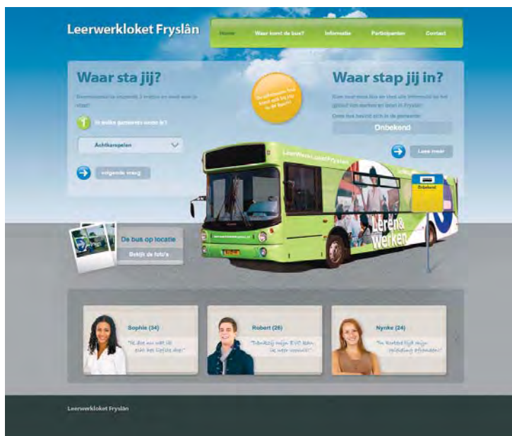
Website 'Leerwerkloket Fryslân'

Marit Wagenmakers, beleidsmedewerker van de gemeente Leeuwarden, benadrukt het belang van goede communicatie. “Aanvankelijk was er niet veel aanloop in de bus. We plaatsten een advertentie in de huis-aan-huis bladen en gingen dan met de bus ergens naar toe. Dat werkte niet.” Aan het