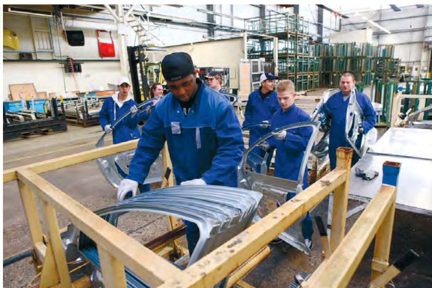
Amersfoortse jongeren in een leer-werkbaan bij voestalpine Polynorm