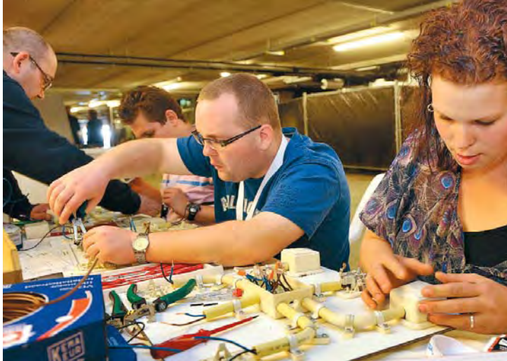
Workshop electro- techniek

het Zumba-dansen waar ze net aan meegedaan heeft. Kinderen hollen door de hal, ballonnen in de hand. In de kelder van het gebouw kunnen zij kleuren en knutselen, terwijl hun moeders een workshop volgen of informatie inwinnen bij een stand over een opleiding of werkgever. Het ijs en de pannenkoeken nemen gretig aftrek.