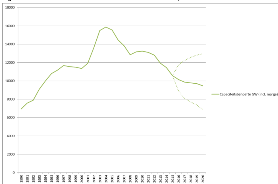
Figuur 4-3: 95% betrouwbaarheidsinterval GW celcapaciteit