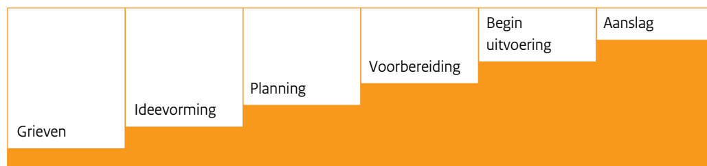
Figuur 1. 'Path to intended violence' (Calhoun & Weston, 2003; uit I-POL, 2007)

Om zicht te krijgen op de ontwikkeling van een bedreiging naar een daadwerkelijke aanslag wordt de schematische weergave van het escalatiespectrum gehanteerd die wordt aangeduid met path of intended violence .