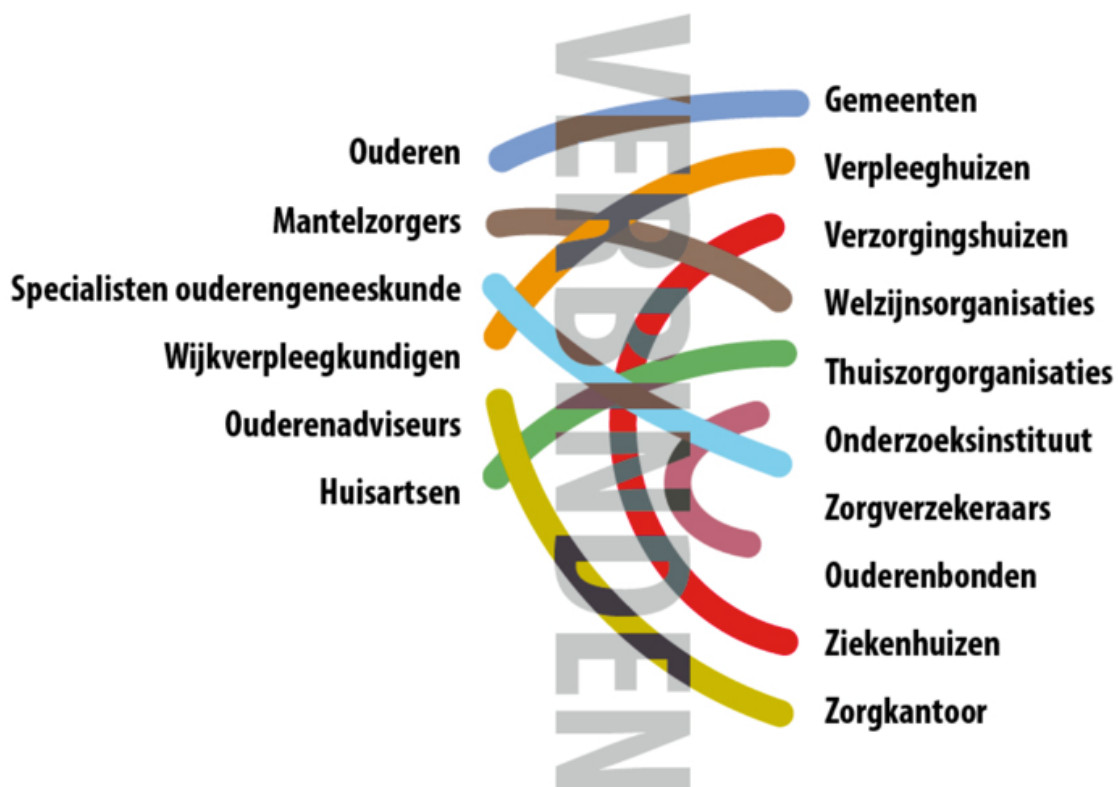
Figuur 4.4 – Het SamenOud-Verbindenlogo

SamenOud verbindt organisaties die relevant zijn voor de zorg en begeleiding van thuiswonende ouderen en de financiering daarvan (zorgverzekeraar en gemeente). Zie ook figuur 4.4. De organisaties maken onderlinge samenwerkingsafspraken over de realisatie en financiering van SamenOud. Deze samenwerkingsovereenkomst beschrijft dat de deelnemende partijen met elkaar integrale zorg voor thuiswonende ouderen volgens het SamenOud-model willen realiseren. De overeenkomst moet minimaal ondertekend worden door de huisartsen, de aanbieders van zorg en welzijn, de zorgverzekeraar en de gemeente(n). 24