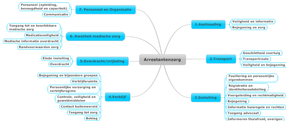
Figuur 2. Onderzoeksaspecten

Aan de hand van interviews, dossier- en documentenstudies en observaties zijn de inspecties nagegaan hoe de politie uitvoering geeft aan arrestantenzorg. Per eenheid hebben de inspecties gesproken met de volgende respondenten: