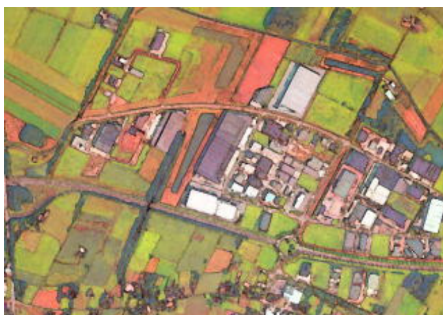
Bedrijventerrein Bijsterhuizen, intergemeentelijke ontwikkeling van Nijmegen en Wijchen