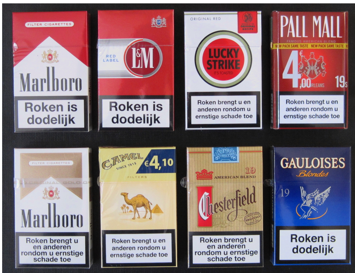
Figuur 2 Afbeeldingen van de verpakkingen van de acht 'meest gerookte' sigarettenmerken.