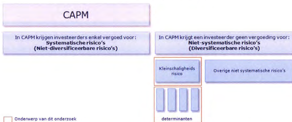
Figuur 1.1 Schematische weergave SFP

Zoals in bovenstaand figuur geïllustreerd zal een investeerder, volgens het CAPM, enkel vergoed worden voor de systematische risico's van een investering. Niet-systematische risico's zoals risico's voortkomend uit kleinschaligheid hebben in CAPM geen invloed op het verwachte rendement.