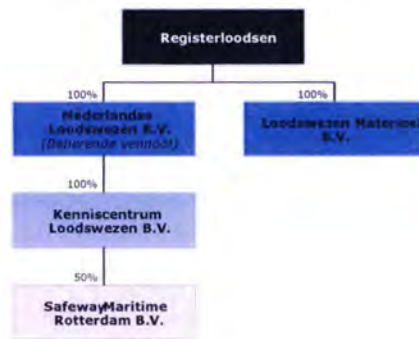
Figuur 5.1 Schematische weergave structuur Loodswezen

De bedrijfsorganisatie Nederlands Loodswezen B.V. ("NLBV") is de facilitaire organisatie die ervoor zorgt dat de registerloodsen ondersteund wordt in de uitoefening van zijn beroep en ook is aangewezen om de loodsgelden te innen. Loodswezen Materieel B.V. is juridisch eigenaar van de vaartuigen die voor het vervoer van de registerloodsen worden gebruikt. Het kenniscentrum Loodswezen B.V. ("KCLW") stelt know-how en vaardigheden van de loodsen en het ondersteunende bedrijf Nederlands Loodswezen B.V. ter beschikking aan internationale opdrachtgevers in de maritieme- en havensector.