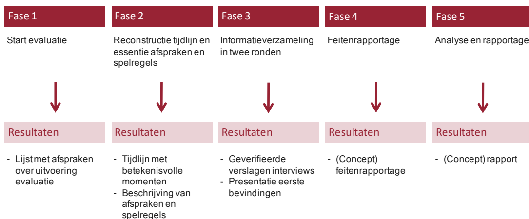
Figuur 1. Gefaseerde aanpak evaluatie besluitvorming, informatie-uitwisseling en projectbeheersing OV SAAL KT cluster c en Doorstroomstation Utrecht

De evaluatie is uitgevoerd in vijf fasen (zie figuur 1).