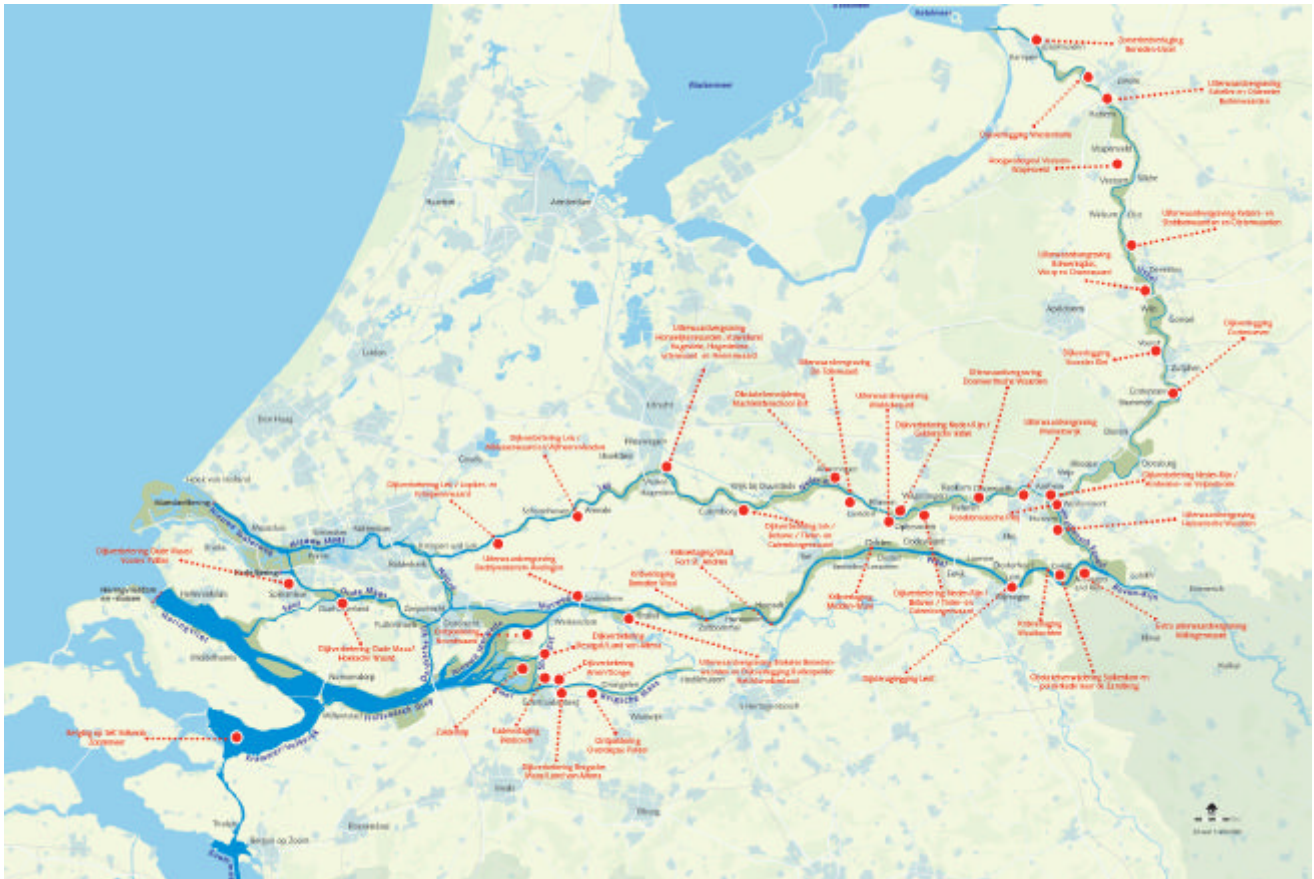
Afbeelding 3.1 Maatregelen Ruimte voor de Rivier

In VGR9 is uitgebreid ingegaan op de scope van het programma Ruimte voor de Rivier. In de daarop volgende voortgangsrapportages worden alleen mutaties in de scope apart in dit hoofdstuk vermeld. Een scopemutatie is aan de orde wanneer de scope in de projectbeslissing (SNIP 3) afwijkt van die in de PKB. De scope beperkt zich tot type maatregel, locatie van de maatregel, ruimtelijke bestemming van het maatregelgebied en de taakstelling voor de MHW-verlaging.