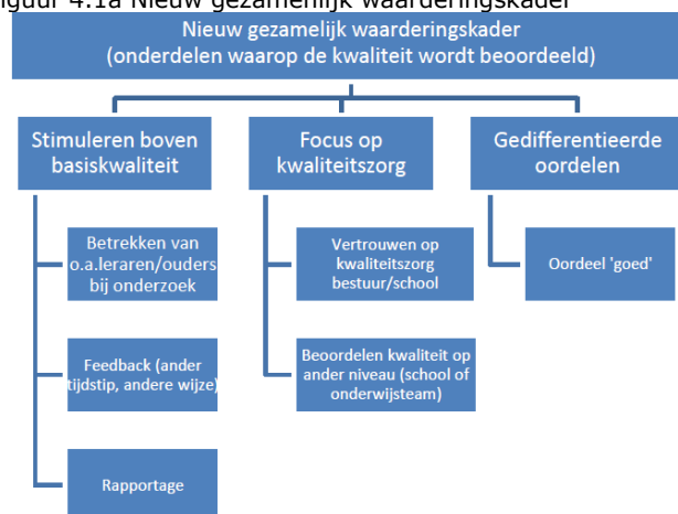
Figuur 4.1a Nieuw gezamenlijk waarderingskader