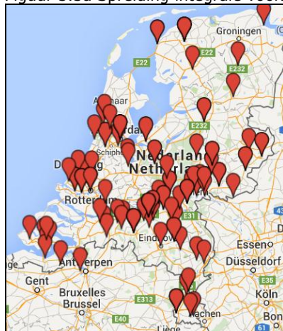
Figuur 3.3a Spreiding integrale voorzieningen