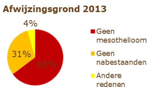
Figuur 1 Afwijzingsgrond 2013

Het aantal negatieve adviezen is relatief laag, met uitschieters in 2008 en 2009 waarin bijna 20% van de aanvragen afgewezen werd. Het grootste aantal afwijzingen 36 is toe te schrijven aan de diagnose, die in dat geval geen maligne mesotheliom luidt. Grofweg een derde van het aantal afwijzingen heeft als reden dat er geen nabestaanden zijn. Dat betekent dat de aanvrager is overleden tijdens het proces en geen directe familieleden heeft. 37 Een zeer beperkt aantal afwijzingen is toe te schrijven aan andere redenen. De afwijzingen in 2013 zijn hieronder in de figuur gecategoriseerd naar afwijzingsgrond. De genoemde percentages zijn representatief voor de eerdere jaren.