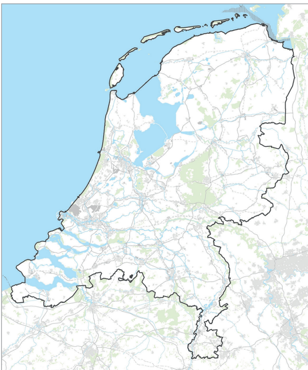
Figuur 1 - Plangebied

Bij de beoordeling van effecten van deze activiteiten wordt ook gekeken welke effecten deze activiteiten hebben op andere activiteiten in de onder- of bovengrond, zoals bijvoorbeeld landbouw en natuur. De effecten van mogelijke schaliegaswinning worden in het planMER voor de Structuurvisie Schaliegas onderzocht. De Structuurvisie Schaliegas zal integraal onderdeel uitmaken van de Structuurvisie Ondergrond.