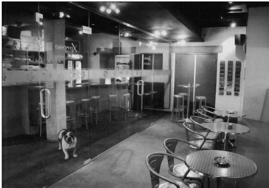
Figuur 3 Voorbeeld van een rookruimte. Dreigt de sociale functie van de coffeeshop verloren te gaan?

terwijl 27% aangaf dat de overlast gestegen is (1 coffeeshop gaf aan dat de overlast minder is geworden). De meeste last ondervindt men van "meer mensen die buiten voor de coffeeshop sigaretten (en joints) roken" en van "buiten voor de coffeeshop rondhangende groepjes mensen". Zie voor een overzicht van de gegevens Tabel 4.