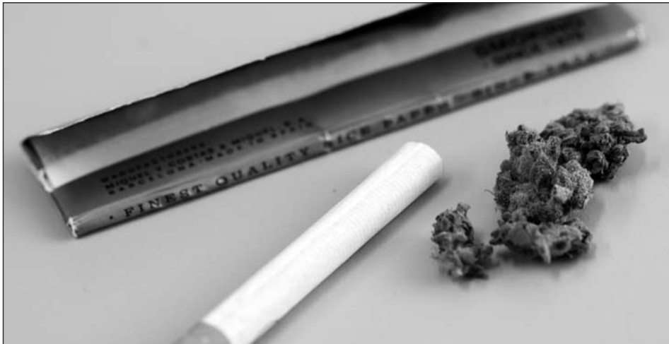
Figuur 2 Ingrediënten voor het maken van een joint. In Nederland bestaat een joint meestal uit een combinatie van cannabis en tabak.

pure joints (optie C), 6 coffeeshops hebben ervoor gekozen de gehele coffeeshop rookvrij te maken (optie E), 3 keer is er voor gekozen om de coffeeshop om te bouwen tot louter een afhaaloket (optie A) en 9 maal is aangegeven dat de coffeeshop vóór de invoering van de rookvrije horeca al een afhaaloket was of heeft men overige maatregelen genomen (optie F), bijvoorbeeld een zeer goed werkend afzuigsysteem. Optie D (geen sigaretten toestaan, maar wel joints met tabak) werd 19 maal genoemd, maar wordt niet onder “het nemen van maatregelen” geschaard. Zie voor een overzicht van de gegevens Tabel 3.