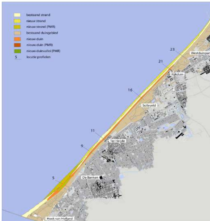
Figuur 1: Locatie duincompensatie Spanjaards Duin langs de Delflandse kust.