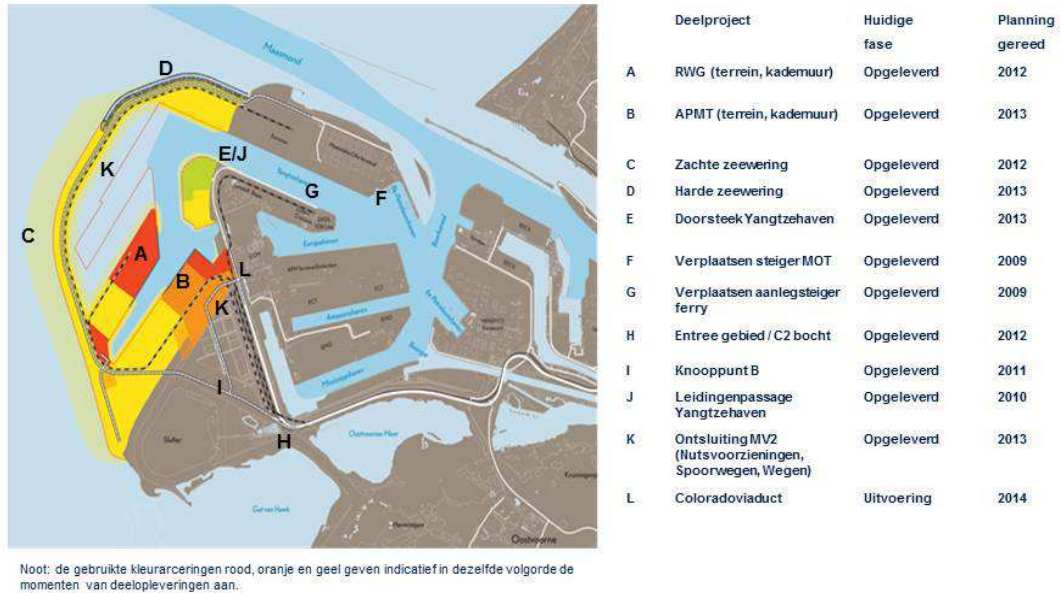
Figuur 1: Overzichtskaart belangrijkste deelprojecten Aanleg Maasvlakte 2 Eerste fase (stand juni 2014)

In deze rapportageperiode zijn als onderdeel van de aanleg van de Maasvlakte 2 (uitsluitend) nog werkzaamheden uitgevoerd die noodzakelijk zijn voor de ontsluiting van Maasvlakte 2 en de aansluiting op de bestaande Maasvlakte 1. Dit zijn de zogenaamde interfaceprojecten, onder meer de aanleg en aansluiting van spoor- en weginfrastructuur inclusief verkeersknooppunten, leidingenpassages en nutsvoorzieningen. Deze deelprojecten zijn of worden uitgevoerd in het kader van de bereikbaarheid van Maasvlakte 2.