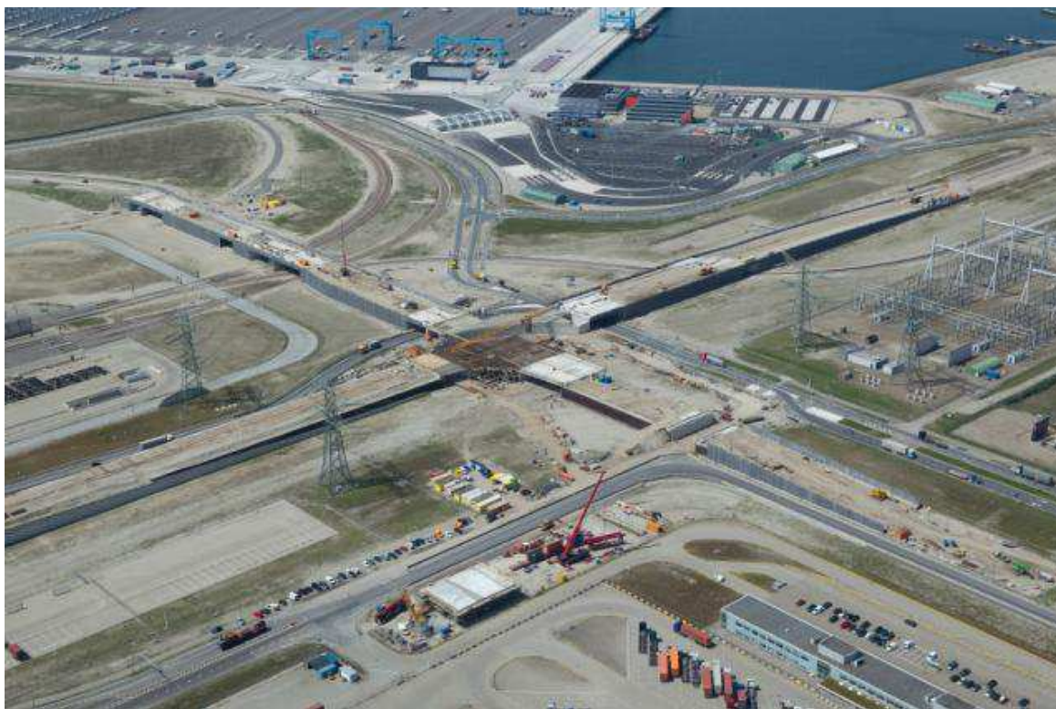
Luchtfoto Coloradoviaduct april 2014