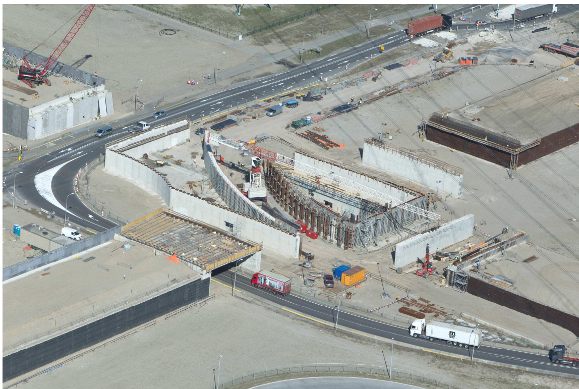
Luchtfoto Coloradoviaduct maart 2014

Ter illustratie van de voortgang van de aanleg van de Maasvlakte 2 in de rapportageperiode is een tweetal luchtfoto's opgenomen van het Coloradoviaduct.