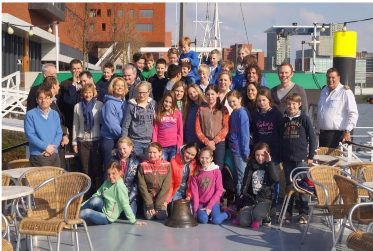
Boottocht door de haven van Rotterdam, 4 maart 2014