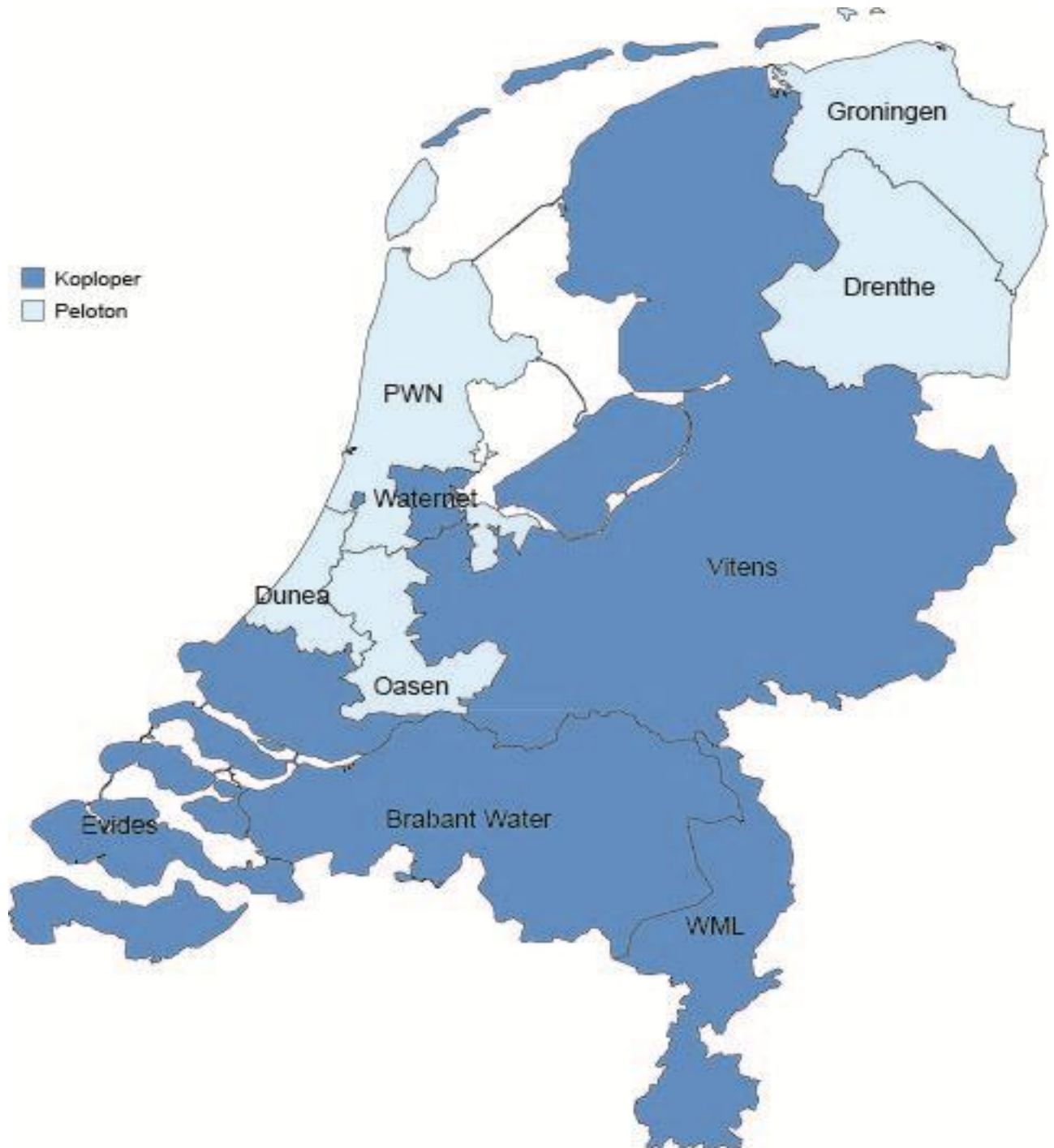
Totaalbeeld drinkwaterbedrijven: koplopers – peloton – achterblijvers