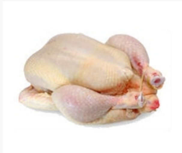
Vleeskuiken geslacht op 6 weken leeftijd

De 192 eieren, die in Nederland gemiddeld per persoon per jaar worden gegeten, komen overeen met ongeveer 70% van de jaarlijkse productie van een leghen. Leghennen worden na ruim een jaar produceren vervangen. Omdat er evenveel haantjes als hennetjes geboren worden, zijn er per gezin van 2-4 personen per jaar dus twee à drie haantjes, die bij de jaarlijkse consumptie van eieren horen en twee à drie soepkippen.