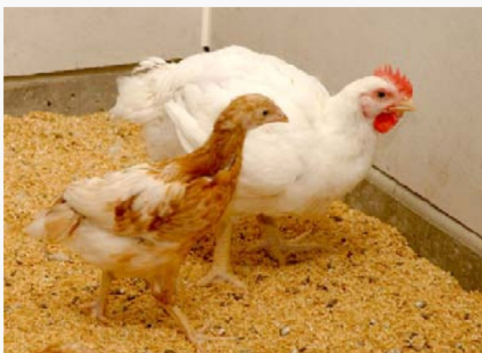
Vleeskuiken en leghennetje (6 weken)

Het marktaandeel van biologische en overige producten met keurmerk is sterk groeiende. Per persoon wordt ongeveer 22 kg pluimveevlees per jaar gegeten. Daarvan is 40% borstfilet. De consumptie van hele kip is zeer beperkt in Nederland, ongeveer 3% van de totale kipconsumptie. Vijftig jaar geleden werd in Nederland nog vooral hele kip (kuiken) gegeten. Vleeskuikens zijn van een ander ras dan leghennen; dat uit zich in verschillende kenmerken. Leghennen hebben op volwassen leeftijd een gewicht van 1800 à 2000 g. Vleeskuikens worden geslacht op een gewicht van 2000 a 2500g en bereiken dat gewicht op een leeftijd van 6 (reguliere vleeskuikens) tot 8 (vleeskuikens met een ster Beter Leven) weken. Biologische kuikens worden op een leeftijd van 10 weken geslacht en wegen dan 2500-3000g. Haantjes van legrassen wegen op een leeftijd van 6 weken 500 g, van 8 weken 800 g en van 10 weken 1000 g. Uitgelegde hennen worden op een leeftijd van 75-100 weken geslacht. Een geslachte uitgelegde hen wordt ook wel soepkip genoemd. Soepkippen worden vaak gebruikt voor verder bewerkte producten (bouillon met kip, loempia's, kant-en-klaar maaltijden). Van de huishoudelijke aankopen van pluimveevlees in Nederland is slechts 0,7% soepkip.