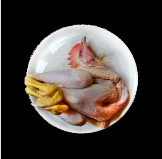
Legras haantje geslacht op 10 weken leeftijd