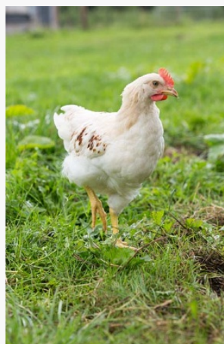
Legras haantje (10 weken)