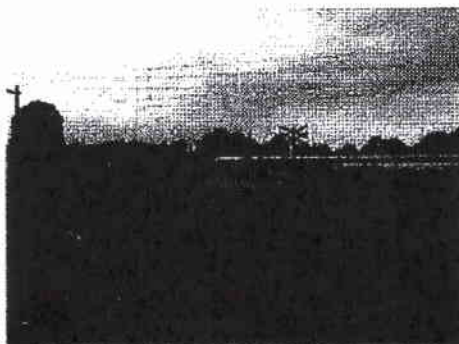
ZUIDZIDE OVERWEG WOUDWEG

De overweg Woudweg in de plaats Teuge in de gemeente Voorst is een particuliere overweg en is niet bestemd voor openbaar gebruik. De overweg is aan beide zijden gemarkeerd met Andreaskruisen en schrikhekken. De naar de overweg toeleidende particuliere onverharde weg is zowel aan de noord- als de zuidzijde van het spoor voorzien van bebording die aangeeft dat deze uitsluitend voor verkeer door en ten behoeve van de rechthebbende bedoeld is. De particuliere weg staat niet bekend als een sluiproute.