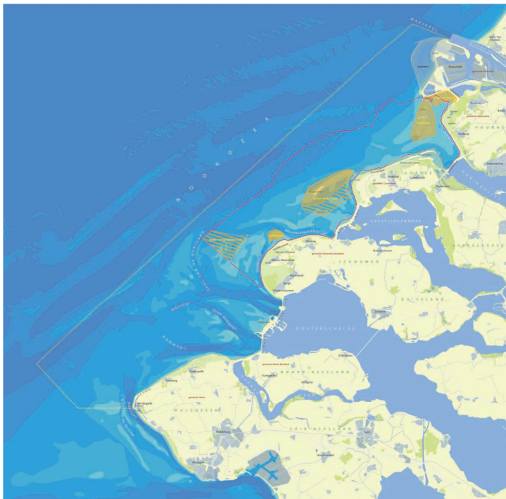
Figuur 2: Voordelta en het daarin gelegen bodembeschermingsgebied (binnen de rode contour) met rustgebieden (geel: jaarrond en geel gearceerd: alleen gedurende de winter)