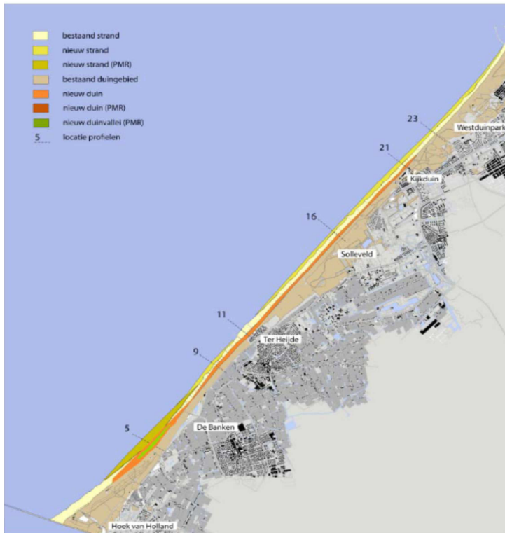
Figuur 1: Locatie duincompensatie Spanjaards Duin langs de Delflandse kust.