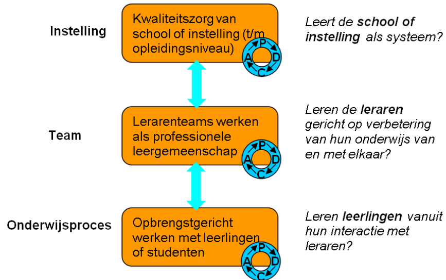
Figuur 2.3b Drie gekoppelde verbetercycli voor het werken aan goede onderwijskwaliteit*