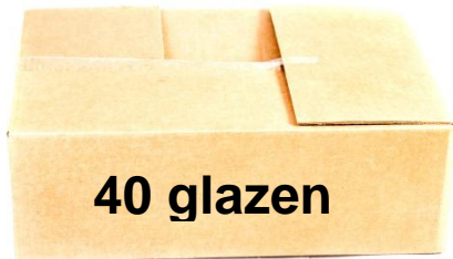
Tabel 3. Resultaten op item 3

Op de B-toets is het verschil tussen leerlingen met en zonder dcv voor vo niet significant (Sig=0,515) en voor mbo ook niet (Sig=0,398)