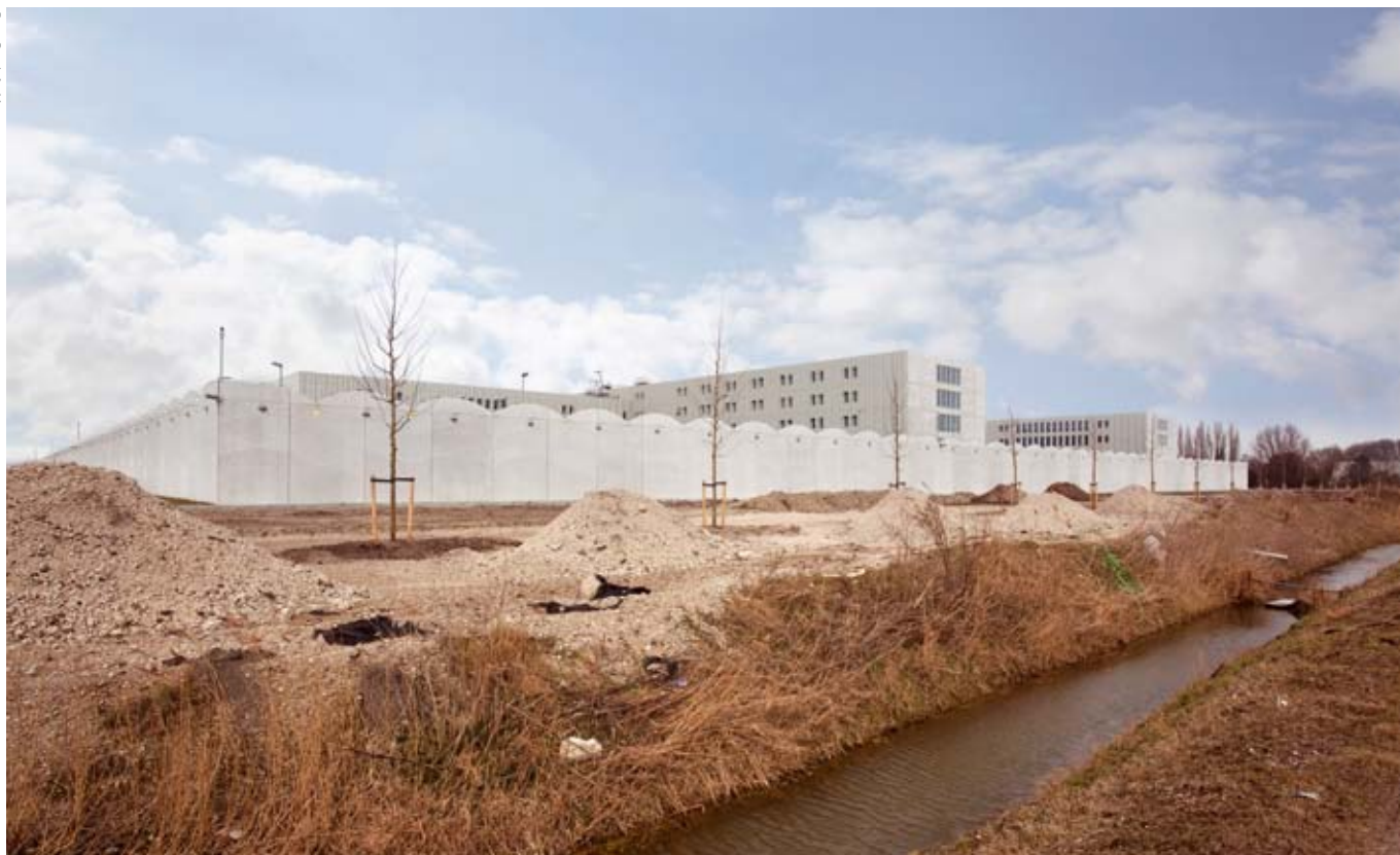
Binnen het strafrecht is detentie de zwaarste sanctie die kan worden toegepast.