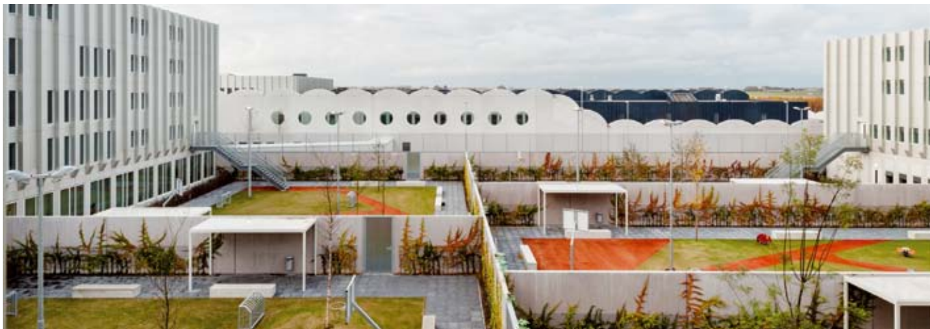
Asielzoekers die niets anders gedaan hebben dan asiel aanvragen, horen niet achter tralies.