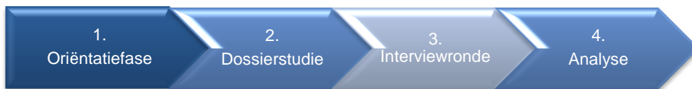
Figuur 1. Fasen in evaluatieonderzoek.

Fase 1 was de oriëntatiefase . Doel van deze fase was het nader uitwerken van de verschillende onderzoeksfasen en het vaststellen van het evaluatiekader. In deze fase zijn verschillende oriënterende gesprekken gevoerd.