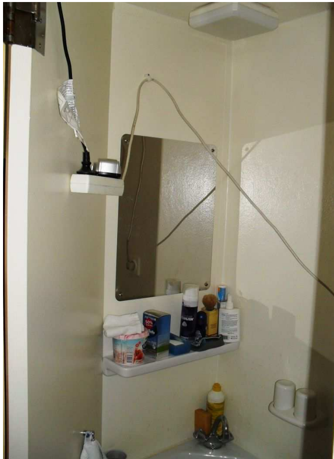
Losse verlengsnoeren met een stekkerdoos boven de wastafel in een cel.