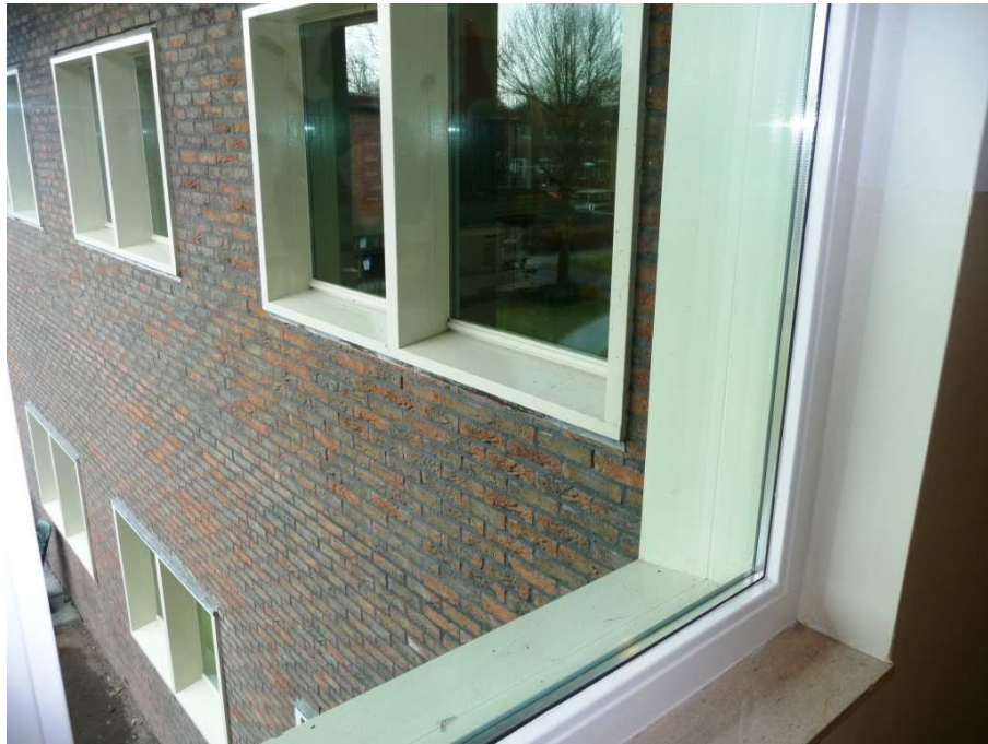
Risico van brandoverslag via ramen zonder brandwerend glas.

In deze bijlage zijn door de inspecteurs gemaakte foto's opgenomen van enkele bij het locatieonderzoek aangetroffen situaties.