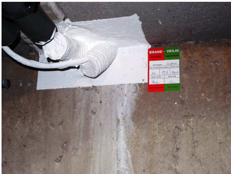
Goed afgewerkte doorvoeringen door een brandwerende scheiding.