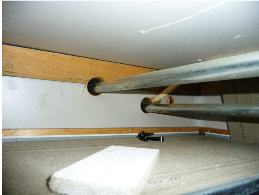
Niet afgewerkte doorvoeringen door een brandwerende scheiding.