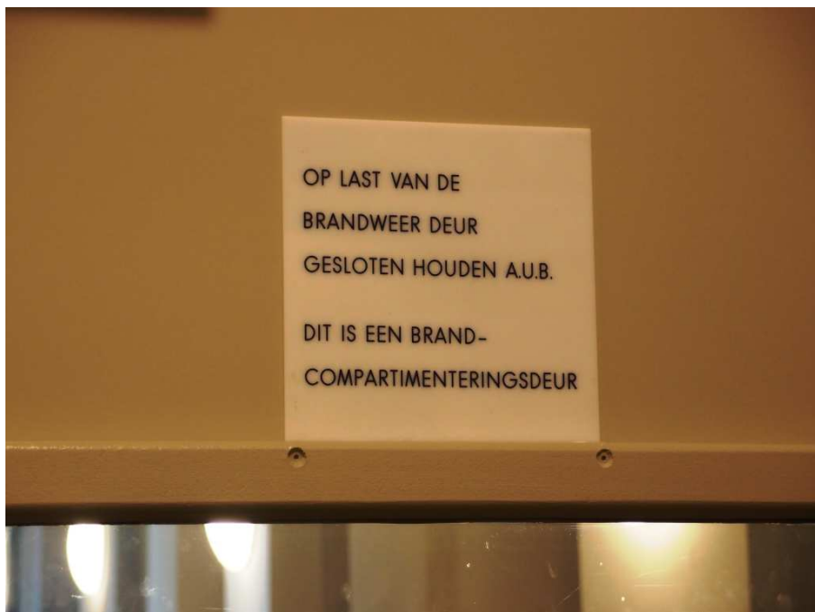
Waarschuwing op een brandwerende deur.