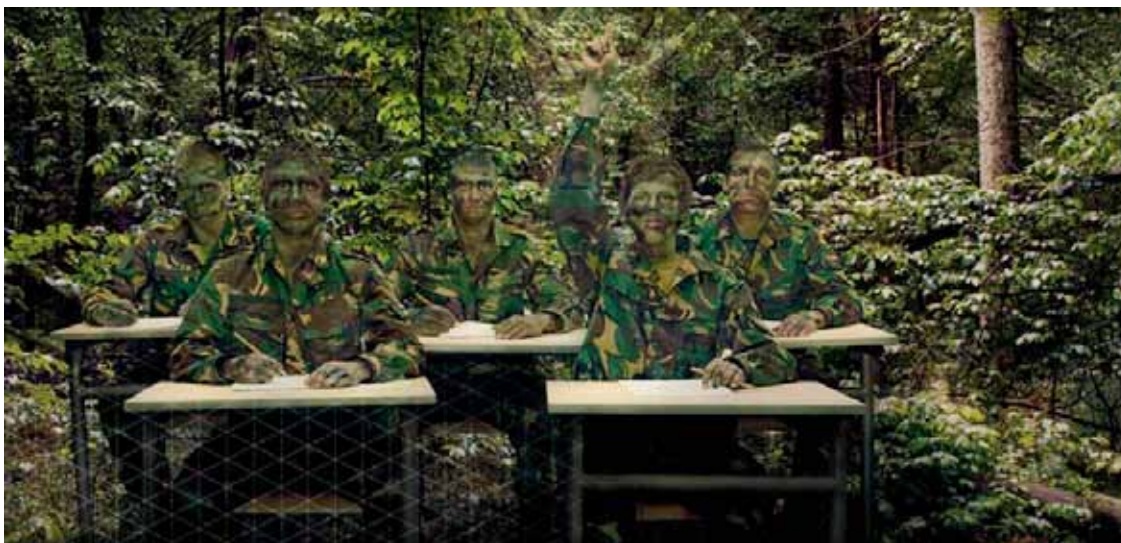
MBO halen en militair worden?

Bij verhuizing van de KMS naar Ermelo worden de reiskosten voor deze leerlingen, die door Defensie worden vergoed, hoger. Ook dit pleit er voor om de KMS in Weert te handhaven. Bundeling van de opleidingen Veiligheid en Vakmanschap en een landelijk EVC-centrum in de regio Brainport 2020 in de nabijheid van de KMS biedt vele voordelen.