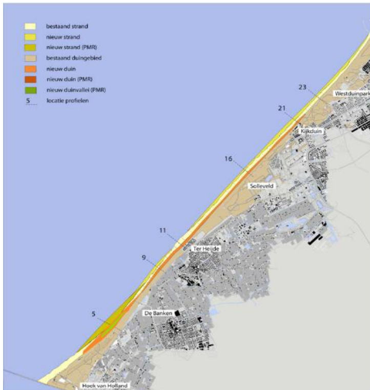
Figuur 1: Locatie duincompensatie Delflandse Kust en zwakke schakel Delfland.