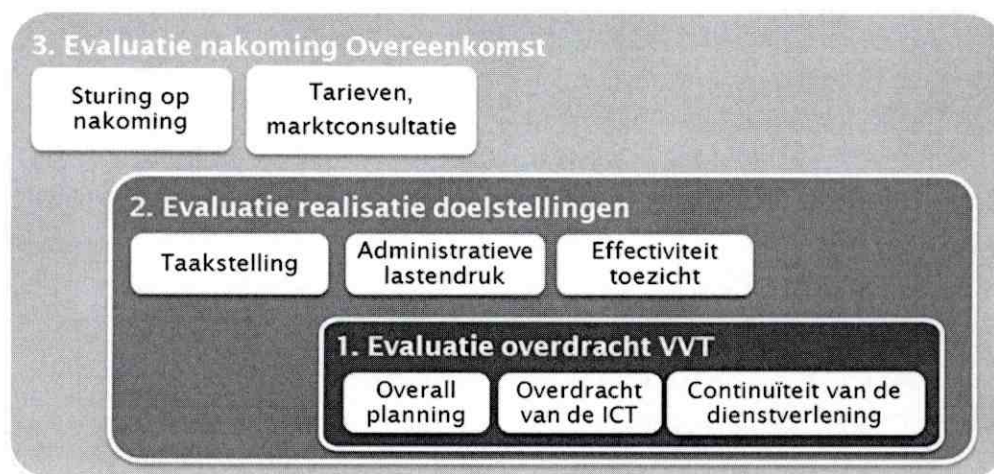
Figuur 1: Onderzoeksbenadering Evaluatie overdracht vergunningverlenende taken

Ten einde een zo compleet mogelijke weergave te presenteren van de overdracht van vergunningverlenende taken van IVW naar Kiwa wordt vanuit drie invalshoeken geëvalueerd. Deze invalshoeken zijn in onderstaande figuur gevisualiseerd.