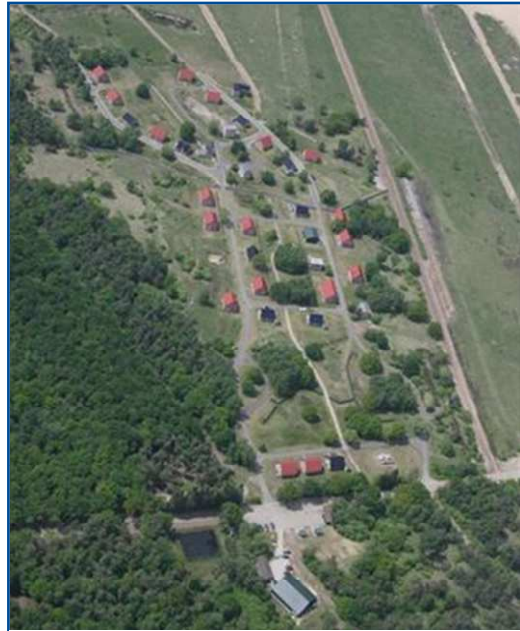
Referentie: oefendorp Oostdorp (ISKH)

Ook een schiethuis, waarin met scherpe munitie geoefend kan worden, behoort ruimtelijk tot de mogelijkheden. Hiervoor wordt echter binnen Defensie een afzonderlijk traject doorlopen zowel qua behoeftestelling als financiering.