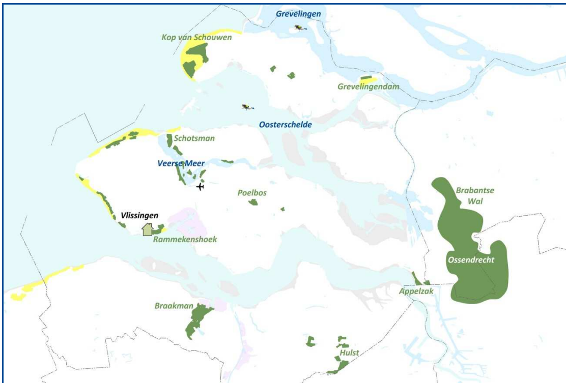
Kaart 7: Potentiële oefenlocaties in Zeeland

Ook bijzondere vormen van oefenen zoals duiken, parachutespringen en skiën kunnen in Zeeland plaats vinden: het duiken gebeurt al in Zeeland (in het bijzonder in de Grevelingen) en parachutespringen kan op vliegveld Midden-Zeeland. Daarvoor wordt, net als nu al het geval is, overigens opgestegen vanaf vliegbasis Eindhoven. Voor het skiën is in Zeeland de skihal in Terneuzen beschikbaar.