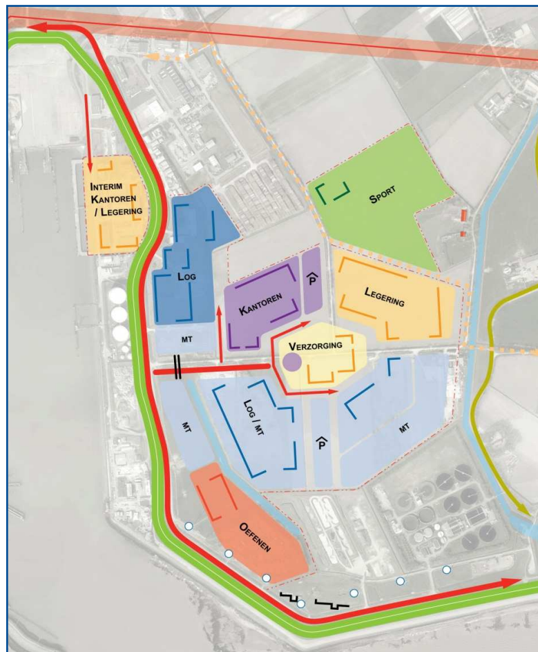
Kaart 5: Indicatieve vormgeving variant A nieuwe kazerne.

In de inrichtingsschets voor variant A behoudt de bestaande Marinekazerne een functie als legeringsgebied. Hierdoor kan de bestaande Marinekazerne als satelliet fungeren en hoeft deze niet voor voertuigen verbonden te worden (wel een loop/fietspoort). Voordeel van deze optie is dat de reeds beschikbare legeringscapaciteit van 300 bedden kan worden benut voor de interim legeringsbehoefte en niet nieuw hoeft te worden gebouwd.