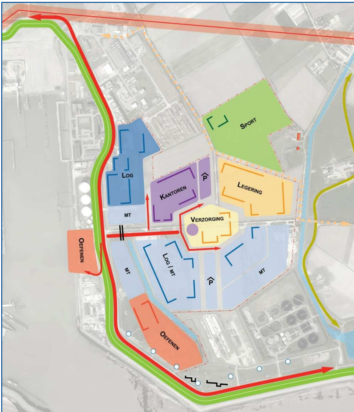
Kaart 6: Indicatieve vormgeving variant B nieuwe kazerne (uiteindelijke voorkeursvariant)

De inrichtingsschets van variant B gaat niet uit van het gebruik van de bestaande Marinekazerne. Deze kazerne wordt omgeuild voor een terreindeel elders in de Buitenhaven waar een kade kan worden gemaakt. Dit gebied hoeft niet rechtstreeks in verbinding met de kazerne te staan, maar moet wel goed ontsloten zijn. Een dergelijke ontsluiting is bijvoorbeeld reeds aanwezig bij het Trainingscentrum Vlissingen.