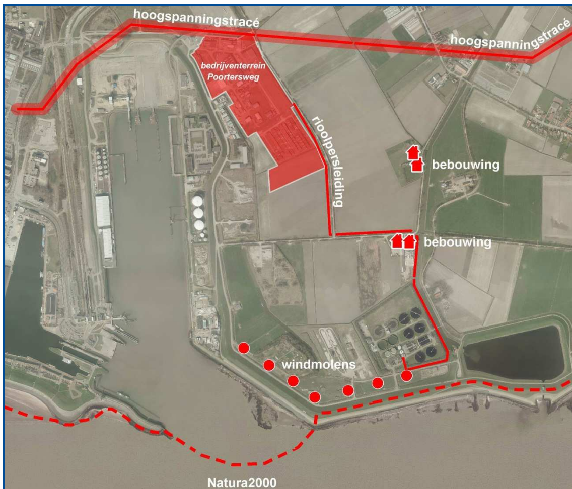
Kaart 3: Aandachtspunten bij ontwikkeling