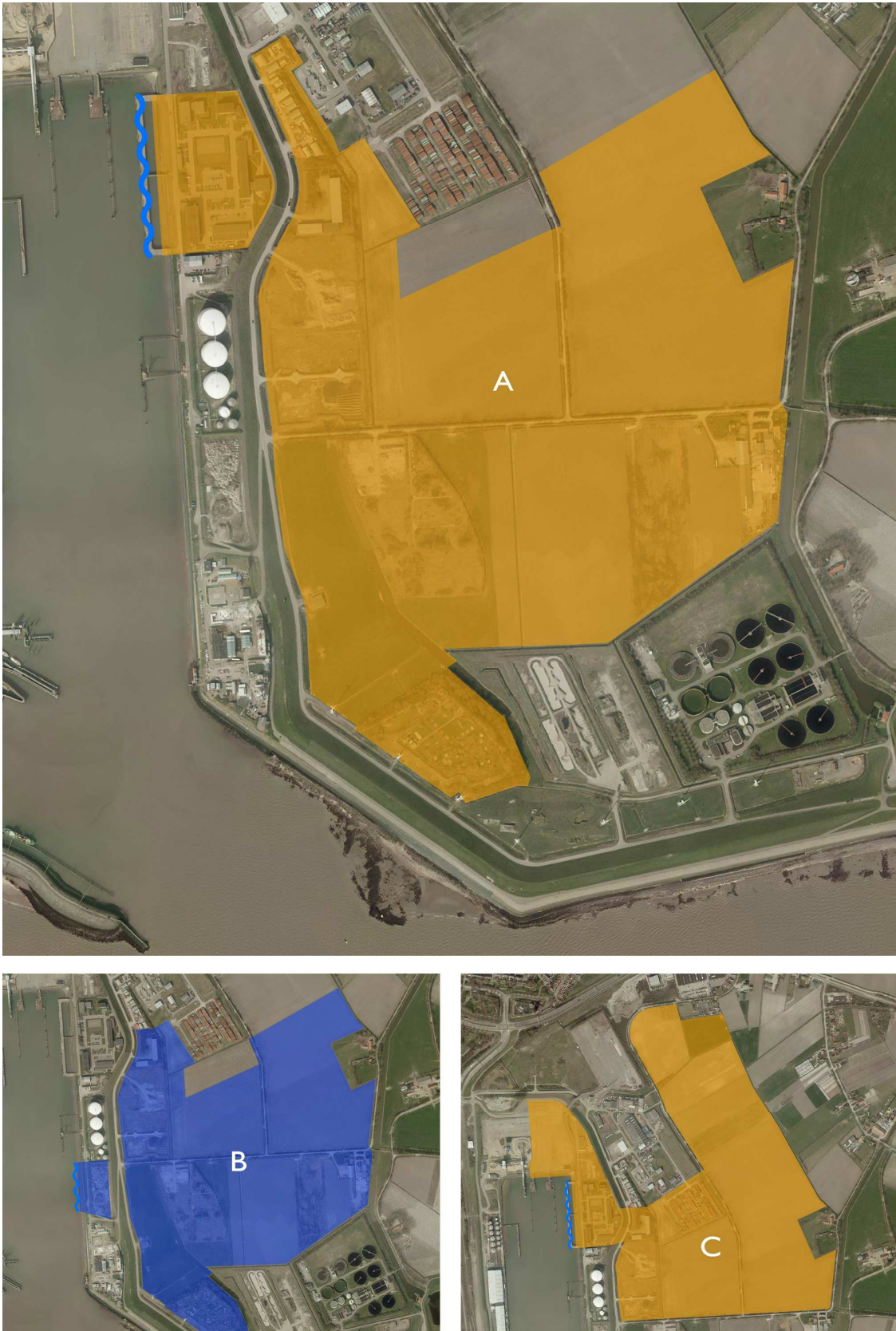
Kaart 4: Voorkeursvariant kavelvorm (variant A ) en varianten B en C. Alle grenzen indicatief.