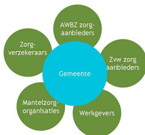
Afbeelding 1: lokale en regionale betrokken partijen bij mantelzorgondersteuning

De insteek was om bij elke geselecteerde gemeente één aanpalend terrein te onderzoeken. In tegenstelling tot de voorgestelde aanpak waarin we op basis van de deskresearch zelf een selectie van de aanpalende terreinen zouden maken per gemeente, hebben we aan de beleidsambtenaar en/of wethouder gevraagd om aan te geven met welke aanpalende terreinen zij gezamenlijk optrekken en in de gemeente actief en van betekenis zijn op het gebied van mantelzorgondersteuning. Op deze manier hebben we geprobeerd om contact te maken met de positieve initiatieven die als inspiratiebron voor andere gemeenten kunnen dienen.