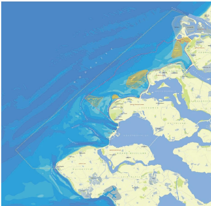
Figuur 2: Voordelta en het daarin gelegen bodembeschermingsgebied (binnen de rode contour) met rustgebieden (geel: jaarrond en geel gearceerd: alleen gedurende de winter)

Onderstaande figuur 2 laat zien waar het bodembeschermingsgebied met de bijbehorende rustgebieden is gelegen in de Voordelta.