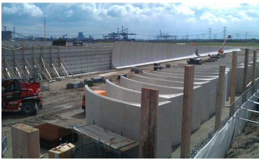
Figuur 4: Foto Knooppunt B in uitvoering (juli 2011)