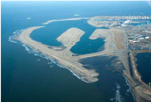
Figuur 2: Luchtfoto Maasvlakte 2 in aanleg (januari 2011)

Ter illustratie van de voortgang van de aanleg zijn hieronder opgenomen de (lucht)foto's van de Maasvlakte 2 in aanleg in januari 2011 (figuur 2) respectievelijk in juli 2011 (figuren 3 t/m 5).