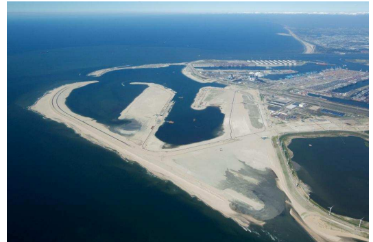
Figuur 3: Luchtfoto Maasvlakte 2 in aanleg (juli 2011)