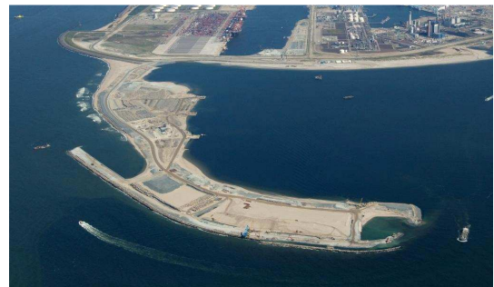
Figuur 5: Luchtfoto Zeewering in aanleg (juli 2011)

In de geldende vergunningvoorwaarden is het Havenbedrijf Rotterdam N.V. de verplichting opgelegd om het Monitoringsplan Aanleg van Maasvlakte 2 ten behoeve van het bevoegd gezag (RWS en EL&I) uit te voeren. De daaruit verkregen metinggegevens dienen vervolgens aan het bevoegd gezag voor beoordeling te worden verstrekt. Het door het Rijk vastgestelde Monitoringsplan Aanleg van Maasvlakte 2 (2009-2013) wordt sinds 2009 dan ook door PMV2 uitgevoerd en hierover wordt gerapporteerd aan het bevoegd gezag. De uitvoering van het monitoringsplan verloopt tot dusver volgens plan. De meetresultaten van de afgelopen rapportageperiode tonen aan dat de werkelijke effecten binnen de bandbreedte blijven die is voorspeld in het MER. De formele evaluatie door het bevoegd gezag zal in 2014, 5 jaar na start uitvoering, plaatsvinden.