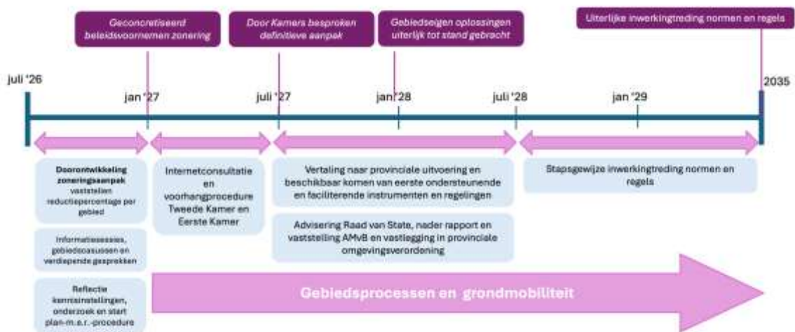
Fig. 1. Tijdslijn zoneringsaanpak t/m 2035