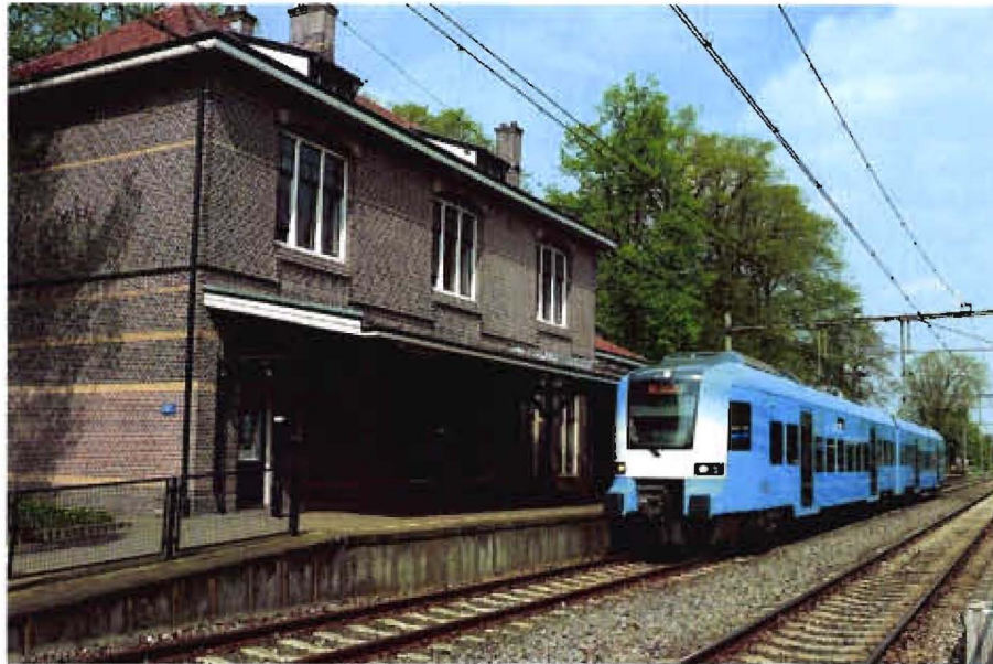
Afbeelding 4: Protos materieel op de Valleilijn