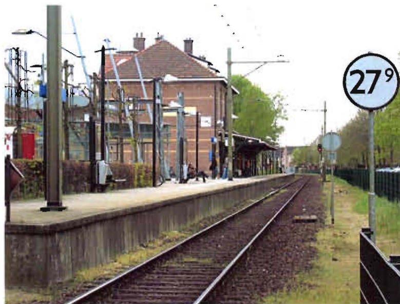
Afbeelding 3: station Ede Centrum. Aan de rechter zijde is ruimte voor een eventueel passeerspoor en een tweede perron