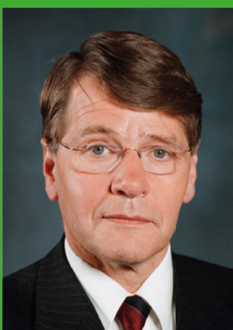
De minister van Binnenlandse Zaken en Koninkrijksrelaties,

In mijn ogen biedt deze één-op-één vorm van kennisuitwisseling veel perspectief. Ik nodig daarom nog meer gemeenten uit om gebruik te maken van de diensten van het Expertteam. Graag wens ik alle gemeenten veel succes met het vormgeven van de initiatieven van hun bouwende burgers.