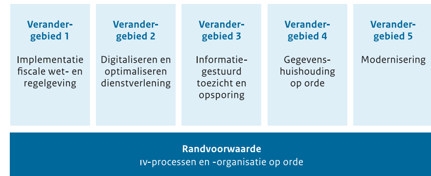
Figuur 1. Vijf iv-verandergebieden en een randvoorwaarde

Samen dekken de vijf verandergebieden af wat in ons iv-landschap moet veranderen om de strategische prioriteiten van de Belastingdienst te realiseren. Deze veranderingen in het iv-landschap vergen ook verbeteringen in de iv-werkwijze en -organisatie. Onder meer om de voorspelbaarheid te verhogen en de beheersing te vergroten. Verbeteringen op het gebied van de iv-werkwijze en -organisatie zijn een randvoorwaarde voor de andere verandergebieden.