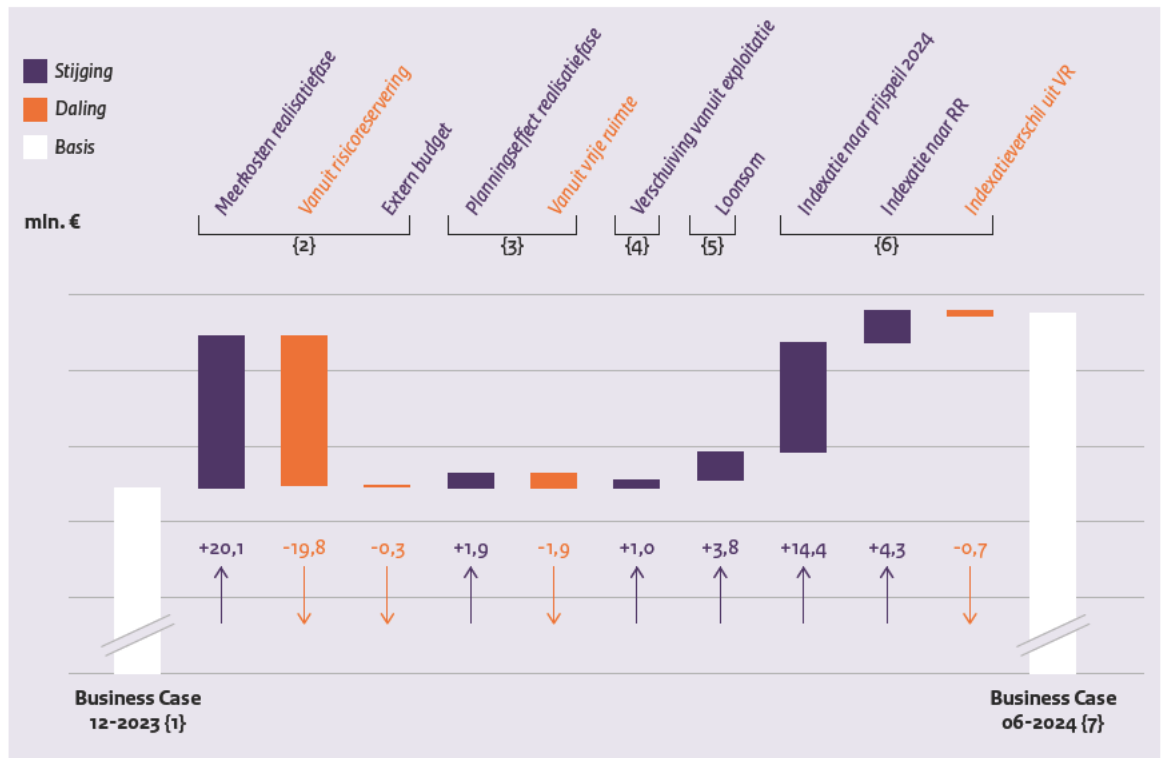
Figuur 2 Financiële ontwikkeling programmakosten per 30 juni 2024

Risicoreservering: De risicoreservering neemt als gevolg van bovenstaande uitputting – per saldo – af met circa € 15,5 miljoen. Na actualisatie van de risico-inschatting van het programma blijkt dat de reguliere risicoreservering per 31-12-2023 geen ruimte meer biedt voor de volledige impact van de benoemde risico's. Hierdoor zal bij een tegenvaller mogelijk de vrije ruimte worden aangesproken. In de commercieel vertrouwelijke bijlage wordt dit in detail toegelicht.