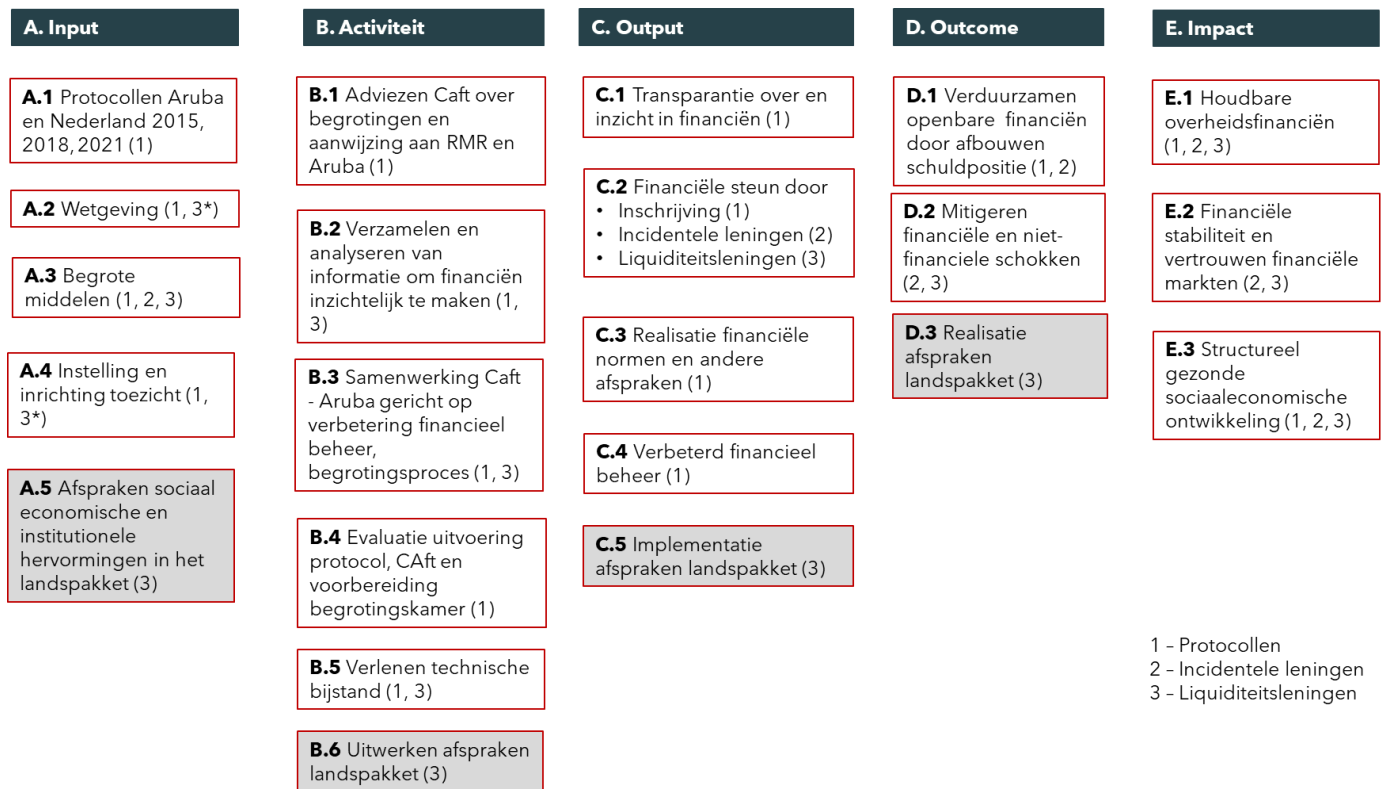
Figuur 5.2 Beleidstheorie artikel 5 begroting IV Koninkrijksrelaties Aruba

De onderdelen die zien op afspraken rond sociaaleconomische en institutionele hervormingen (A.5, B.6, C.5 en D.3) zijn in de beleidstheorie grijs weergegeven omdat deze in principe geen onderdeel uitmaken van artikel 4 begroting IV Koninkrijksrelaties. Ze maken echter wel onderdeel uit van het doel van individuele beleidsinstrumenten (de liquiditeitssteun) die ook activiteiten en output bevatten die als doel hebben een structureel gezonde sociaaleconomische ontwikkeling te realiseren via andere wegen dan puur financiële instrumenten of toezicht. Onder impact is de doelstelling niet grijs weergegeven, omdat ze wel integraal onderdeel uitmaakt van de langetermijndoelstelling van artikel 5, zoals blijkt uit teksten bij de rijksbegroting.