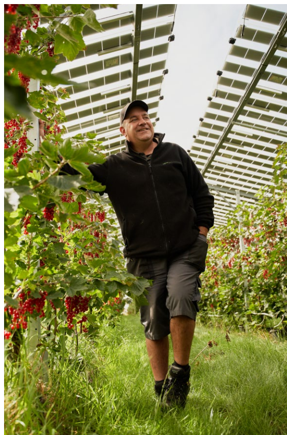
Rode bessen onder zonnepanelen

Coöperatie met 400 leden, met 5.500 hectare fruitareaal verspreid over heel Nederland en een klein deel in België. Erkende producentenorganisatie voor appel, peer, aardbei, rode en blauwe bessen, frambozen en bramen.