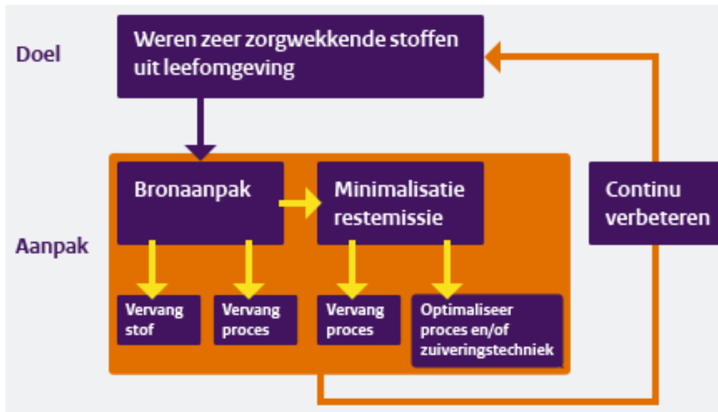
Figuur 2.1 Schematische weergave van ZZS-minimalisatie emissie beleid

In figuur 2.1 is de aanpak van het ZZS-emissiebeleid schematisch weergegeven.