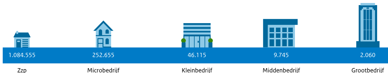
Figuur 1.1: Aantal bedrijven. Periode 4 e kwartaal 2022.