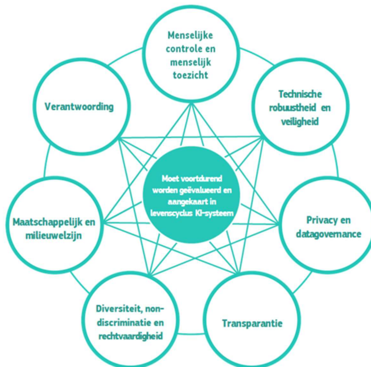
Figuur 3 Onderlinge verhouding van de zeven thema's (overgenomen uit de Ethische richtsnoeren)

Centraal bij de thema's staat de continue evaluatie van de inzet en de governance daaromheen. Naast de normen en maatregelen zijn daarom ook de organisatorische aspecten van de inzet van algoritmen van belang, zoals bewustzijn, cultuur, governance en mogelijkheden voor ethische reflectie. Deze aspecten zijn verder uitgewerkt in hoofdstuk 4 van dit implementatiekader.