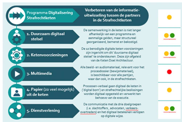
Tabel: Stand van zaken van de vijf digitaliseringsdoelen

Het programma PDSK wordt afgesloten met de kleurstelling 'oranje'. De kleurstelling geeft weer dat overall gezien de PDSK-digitaliseringsdoelen zijn gevorderd, maar niet zo volledig zijn behaald als was voorzien bij de start van het programma.