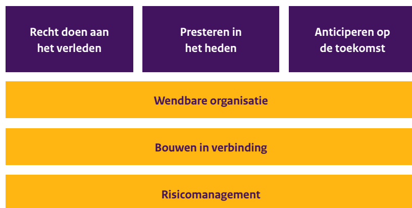
Figuur 1: Veranderopgaven Dienst Toeslagen

Naast onze dagelijkse kerntaak en de inzet op de ambities weten we één ander ding zeker: net als in 2022 zullen er ook in 2023 weer grote actualiteiten gaan spelen die we nu niet kunnen voorzien, maar die wel grote inzet van de Dienst Toeslagen gaan vragen. De context waarin Toeslagen opereert is continu in beweging en ontwikkeling. Deze nu nog niet voorziene actualiteiten kunnen logischerwijs niet opgenomen worden in dit Jaarplan, maar we dienen er als Toeslagen wel rekening mee te houden dat dit een deel van onze schaarse tijd in beslag neemt. Dit kan dan ook effect hebben op onze ambities.